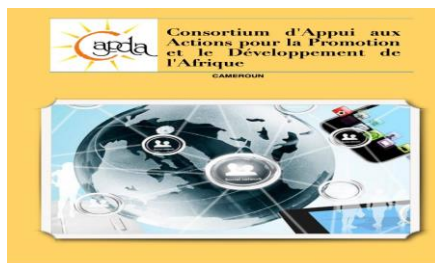
RAPPORT WEBINAIRE CAPDA 23 JUILLET 2020

constitue l'acte I d'un projet triadique que conduira le CAPDA.